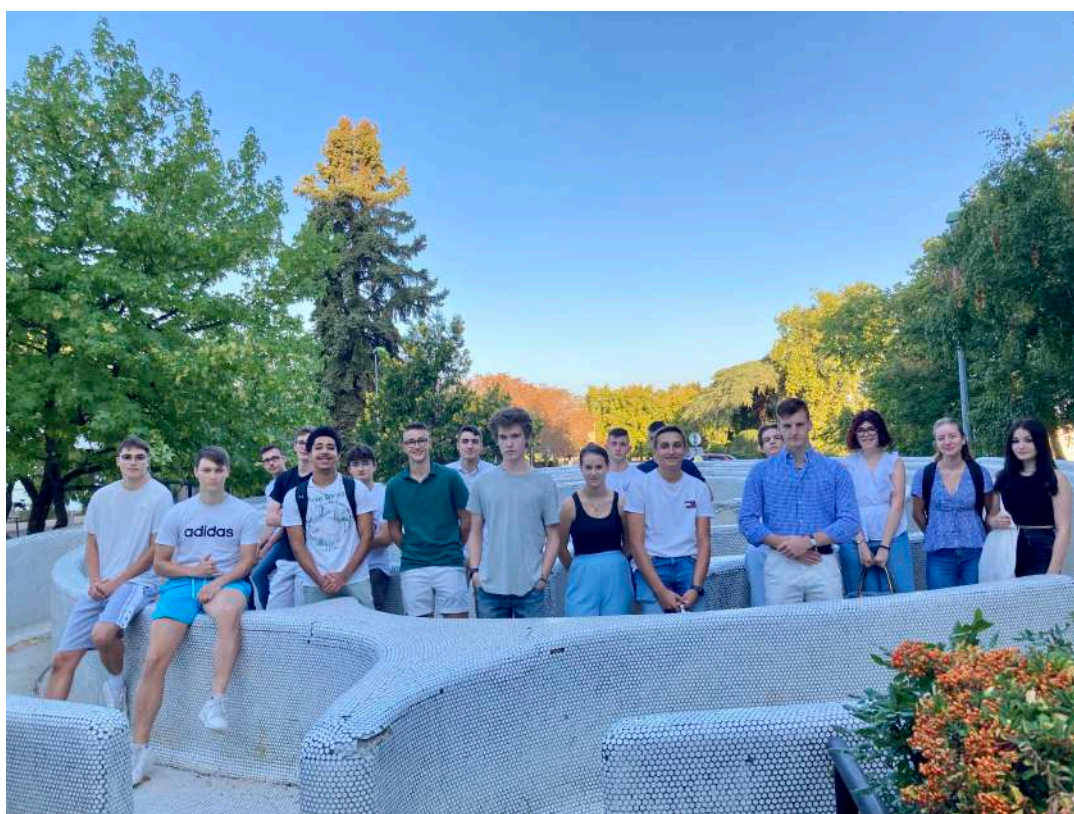
Promotions 2023-2024 Rentrée 2023 Dans le labyrinthe de Martha Pan

Bonnes vacances reposantes et studieuses avant de vous lancer dans l'aventure la plus marquante de votre vie